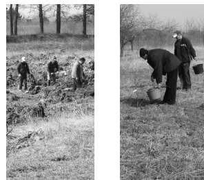
Császárfá helyének előkészítése, gyümölcsfák pótlása.