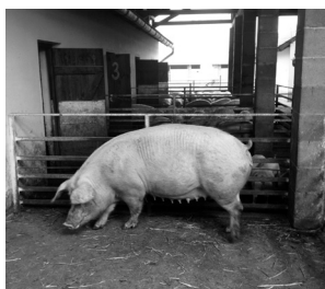
A „legjobb és legidősebb” anya cím birtokosa.