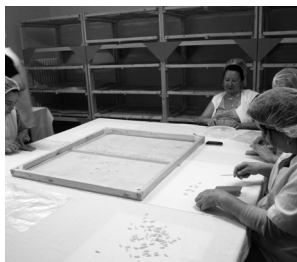
Kapós a csigatészta.