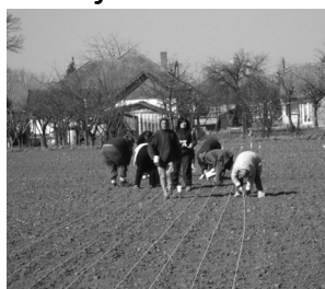
A vöröshagyma dugványozása.