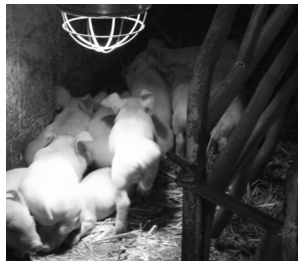
Gyönyörű az állomány. A szaporulattal elégedettek vagyunk, jelenleg 25 db kismalacunk van.