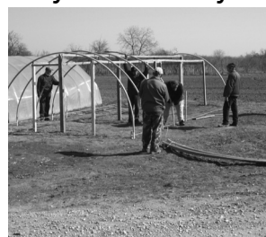
Készül a fóliasátor.