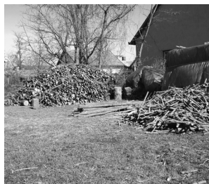
Már a jövő télre készülünk.